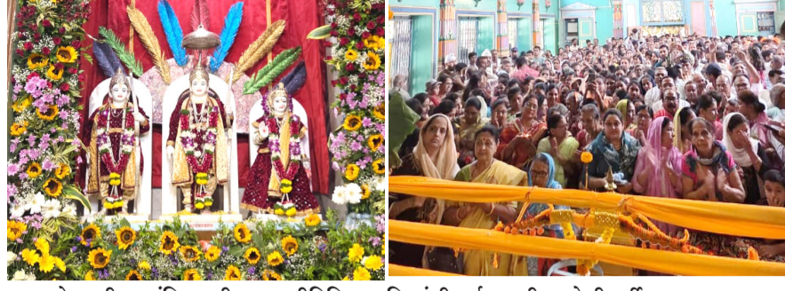
अमळनेर : श्रीराम मंदिरात श्रीराम नवमीनिमित्त भाविकांची दर्शनासाठी झालेली गर्दी.