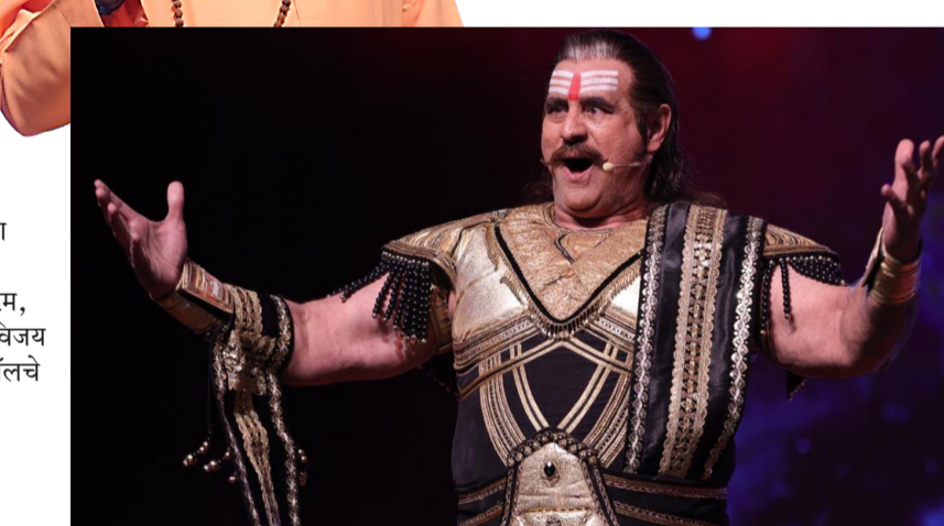
नाट्यप्रयोगावेळी कला सादर करताना दिग्गज अभिनेते, संगीतकार व वाद्य वादक यांच्यासह गायक.