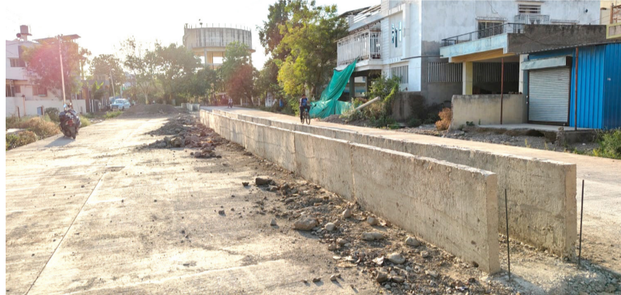
अमळनेर : शहराला जोडणाऱ्या रिंग रोडचे काम काही दिवसांपासून सुरू आहे. मात्र, कोट्यवधी रुपये खर्चाच्या या कामाकडे ठेकेदाराचे दुर्लक्ष झाल्याने त्याला पाणीटंचाईची झळ बसत असल्याचे दिसून येत आहे.

अमळनेर : शहराला जोडणाऱ्या रिंग रोडचे काम काही दिवसांपासून सुरू आहे. मात्र, कोट्यवधी रुपये खर्चाच्या या कामाकडे ठेकेदाराचे दुर्लक्ष व पाणीटंचाईची झळ बसत असल्याचा आरोप शहरवासीयांकडून केला जात आहे.