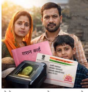
वेळेत रक्कम जमा करणे आवश्यक आहे.

समृद्धी खाते सक्रिय ठेवा प्रॉव्हिडंट फंड खात्यात किमान ५०० रुपये आणि सुकन्या समृद्धी योजना खात्यात किमान २५० रुपये जमा करणे बंधनकारक आहे. हे व्यवहार ३१ मार्चपूर्वी पूर्ण न केल्यास खाते निष्क्रिय होऊ शकते. विशेषतः मुलींच्या भविष्यासाठी असलेली ही योजना सुरू ठेवण्यासाठी