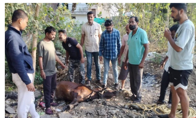
अमळनेर : आर. के. नगर भागातील खुल्या जागेत असलेल्या विहिरीत पडलेल्या गायीला बाहेर काढण्यावेळी एकत्रित आलेले पालिका अग्निशमन दलाचे कर्मचारी.