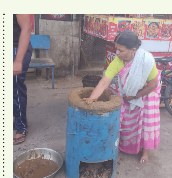
अमळनेर : शहरासह तालुक्यात अजूनही गॅस सिलिंडरची टंचाई जाणवत असल्याने वेगळा पर्याय म्हणून पत्र्याची चूल तयार करताना हॉटेल व्यावसायिक महिला.

दरम्यान, प्रशासनाकडून गॅस सिलिंडरची टंचाई नसल्याचे सांगितले जात असले, तरी प्रत्यक्षात पुरवठा अपुरा असल्याचा आरोप व्यावसायिकांनी केला आहे. या समस्येवर तातडीने तोडगा काढून गॅस सिलिंडरचा पुरवठा सुरळीत करावा, अशी मागणी नागरिकांकडून होत आहे. सध्याची परिस्थिती कायम राहिल्यास आगामी काळात हॉटेल व्यावसायिक आणि गंभीर परिणाम होण्याची शक्यता व्यक्त केली जात आहे.