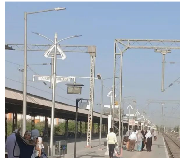
अमळनेर : रेल्वेस्थानकातील प्लॅटफॉर्म क्र. २ वर अपूर्णस्थितीत असलेले शेडचे काम.

उन्हात प्रतीक्षा, शेडचा अभाव आणि सुरक्षिततेच्या दृष्टीने असलेल्या अडचणींमुळे प्रवाशांमध्ये तीव्र नागरीचे वातावरण निर्माण झाले आहे. दरम्यान, स्थानिक प्रवाशांनी या समस्येकडे भारतीय रेल्वे प्रशासनाने तत्काळ लक्ष देण्याची मागणी केली आहे. प्लॅटफॉर्म क्रमांक २ वर अखंडपणे संपूर्ण शेड उभारणे, प्रवाशांसाठी बसण्याची सुविधा उपलब्ध करून देणे, अशी मागणी प्रवाशांकडून करण्यात येत आहे.