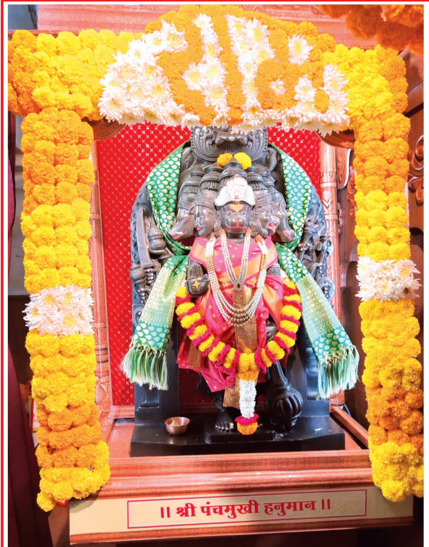
अमळनेर : श्री मंगळग्रह मंदिरातील श्री पंचमुखी हनुमानजी यांच्या मूर्तीवर जन्मोत्सवाच्या पार्श्वभूमीवर बुधवारी सायंकाळी करण्यात आलेली आकर्षक सजावट.