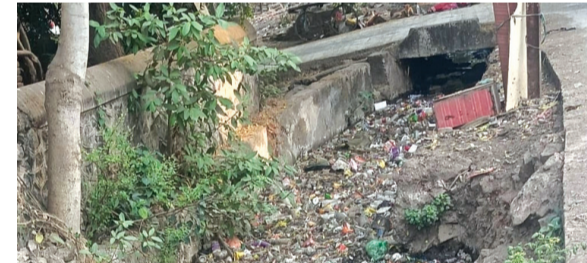
अमळनेर : शहरातील मोठ्या गटारांची साफसफाई होत नसल्याने अशा प्रकारे मोठ्या प्रमाणात घाण, कचरा साचलेला आहे.

आरोग्य धोक्यात आले आहे. शहरातील विविध भागातील नागरिकांच्या म्हणण्यानुसार गटारांमध्ये साचलेले घाण पाणी आणि कचरा हे मच्छर वाढण्याचे मुख्य कारण ठरत आहे. परिणामी लहान मुले आणि ज्येष्ठ नागरिकांच्या आरोग्यावर गंभीर परिणाम होत आहे. (पान २ वर)