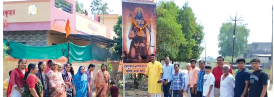
अमळनेर : हनुमान जयंतीनिमित्त आयोजित कार्यक्रमप्रसंगी उपस्थित शिवाजीनगर, हनुमाननगरातील नागरिक. शिवाजीनगर, हनुमाननगरात हनुमान जयंतीचा कार्यक्रम

ग्लोबल महातेज वृत्तसेवा भारतातील जवळपास ९० टक्के नागरिकांकडे बँक खाते आहे. आपले पैसे सुरक्षित राहोवत, यासाठी आपण बँकेत पैसे साठवतो. मात्र बँकेला मराठीत काय म्हणतात हे माहिती आहे का? व्यवहार्य शब्द : मराठी भाषेत 'बँक' या शब्दाचा सर्वाधिक वापर केला जातो. मराठी व्याकरण आणि दैनंदिन संभाषणात हा शब्द पूर्णपणे स्वीकारला गेला आहे. तांत्रिक किंवा औपचारिक शब्द : अत्यंत शुद्ध किंवा शासकीय परिभाषेत बँकेला 'अधिकोष' असे म्हटले जाते. मात्र, हा शब्द व्यवहारात खूप कमी ऐकायला मिळतो. वित्तीय संज्ञा : व्यापक अर्थाने बँकेला 'वित्त संस्था' असेही संबोधले जाते. कारण तेथे पैशांचे (वित्ताचे) व्यवहार चालतात. ऐतिहासिक संदर्भ : जुन्या काळात किंवा आजही छोट्या स्वरूपाच्या खासगी बँकिंग व्यवहारांना 'पेढी' (उदा.- सराफी पेढी) असे म्हटले जाते. बँकेचे मुख्य कार्य : बँक ही अशी संस्था आहे जी लोकांकडून ठेवी स्वीकारते आणि गरजू व्यक्तींना किंवा उद्योगांना कर्ज पुरवते.