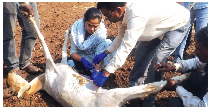
अमळनेर : आंबापिंप्री (ता. पारोळा) येथे शेतातील पिके खाल्ल्यानंतर विषबाधा होऊन बुधवार, दि. १ एप्रिलच्या रात्रीपासून गुरुवार, दि. २ एप्रिल रोजी दुपार या दरम्यान ८५ मेंढ्या दगावल्या. या घटनेची माहिती मिळताच घटनास्थळी पोहोचून उर्वरित मेंढ्यांवर औषधोपचार करताना पारोळ्यातील पशुधन अधिकारी व त्यांचे सहकारी.

अमळनेर : आंबापिंप्री (ता. पारोळा) येथे शेतातील पिके खाल्ल्यानंतर विषबाधा होऊन तब्बल ८५ मेंढ्या दगावल्या आहेत. ही घटना बुधवार, दि. १ एप्रिलच्या रात्रीपासून गुरुवार, दि. २ एप्रिल रोजी दुपार या दरम्यान घडली. या घटनेमुळे परिसरात हळहळ व्यक्त केली जात असून, ठेलारी कुटुंबासमोर मोठे आर्थिक संकट उभे राहिले आहे.