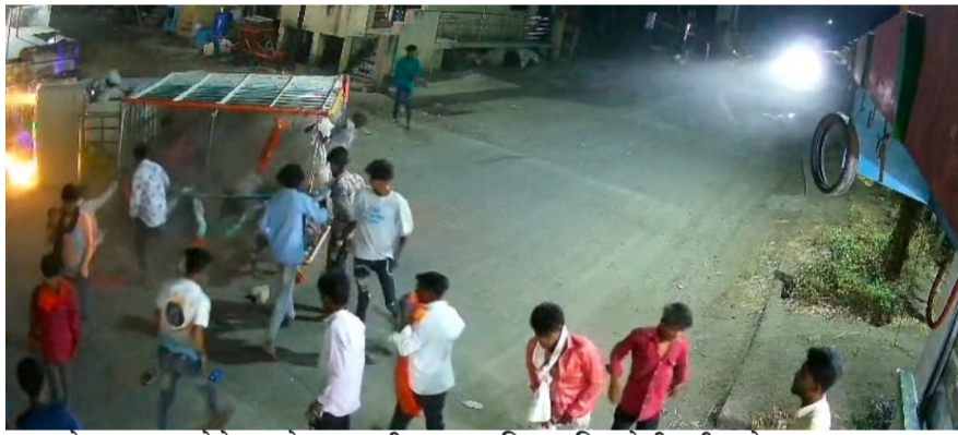
अमळनेर : लडगाव येथे लग्नसोहळ्यासाठी शुक्रवार, दि. ३ एप्रिल रोजी रात्री साडेनऊच्या सुमारास जैतपीर येथे वळणाजवळ उलटलेली हीच ती पिकअप व्हॅन व वन्हाडी.

सदर घटना जैतपीरमधील वळणाजवळील गतिरोधकाचा चालकास अंदाज न आल्याने हनुमान मंदिराला धडक बसल्याने वळणाजवळ घडल्याचे गावकऱ्यांकडून सांगितले जात आहे. मात्र, या घटनेची पोलिसांत कोणतीही नोंद झालेली नाही. गावकऱ्यांनी दिलेल्या माहितीनुसार शिंदखेडा तालुक्यातील वैजापूर, लोण-मुडी व बेतावद, जोयदा, माळीच येथील सुमारे २० ते २५ वन्हाडींना घेऊन