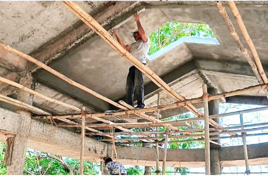
अमळनेर : पैलाड, ताडेपुरा भागातील नागरिकांची गैरसोय दूर करण्याच्या उद्देशातून पालिकेतर्फे सुरू असलेले नवीन स्मशानभूमीचे काम.

येथील पालिकेतर्गत पैलाड व ताडेपुरा भागासाठीची नवीन स्मशानभूमी ८० टक्के बांधण्यात आली आहे. जुन्या स्मशानभूमीतील दाहिन्यांचे तिन्ही ओटे तुटलेले असल्याने अक्षरशः जमिनीवरच अंत्यसंस्कार करावे लागत होते. त्यामुळे मोठी गैरसोय होत होती. दरम्यान, सदर नव्या स्मशानभूमी कामाच्या खर्चाचे बिल जिल्हास्तरावरून प्राप्त झालेले होते. परंतु ऑडिट अर्पूण असल्याने पालिका ठेकेदाराला बिल अदा करत नव्हती आणि ठेकेदारही काम पूर्ण करण्यास तयार नव्हता. त्यामुळे मृतदेहाची विटंबना होऊन संबंधित परिवारातील सदस्य व नातेवाईकांच्या भावना दुखावल्या जात होत्या. याबाबत प्रसिद्धीमाध्यमांनी पालिकेतील