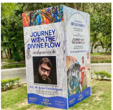
तर कधी निसर्गाचा एक भाग बनून फुले किंवा मधमाश्यांमध्ये रूपांतरीत होतात.