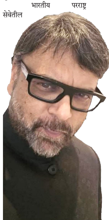
भारतीय परराष्ट्र सेवेतील