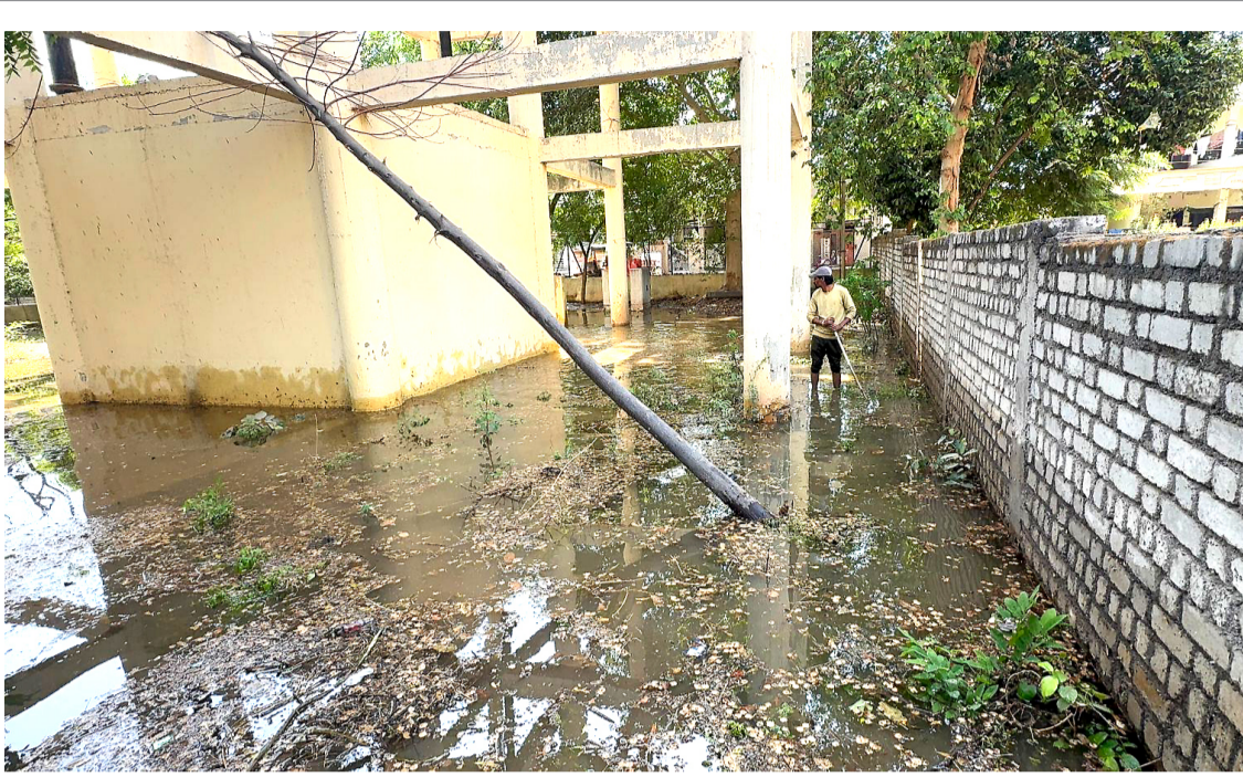
अमळनेर : व्हाँल्व दुरुस्तीच्या कारणाने जलकुंभातून सोडण्यात आलेले पाणी.

स्वातंत्र्यपूर्व संग्रामातील स्वदेशीची हाक आता पुन्हा देवू या. नवरात्रोत्सवात आपण आदिमाया आदिशक्तीचा जागर करतो त्याप्रमाणेच स्वदेशीचाही जागर करूया...! सच्च्या भारतीयांवर जेव्हा-जेव्हा परकीय आक्रमण होते तेव्हा-तेव्हा ते प्रचंड त्वेषाने पेटून उठतात...!! आता तीच वेळ येऊन ठेपली आहे...!! जय भारत...! जय स्वदेशी...!!