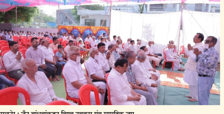
अमळनेर : जैन बांधवांकडून विश्व नवकार मंत्र सामूहिक जप.

महामंत्राचे महत्त्व व त्यामागील आध्यात्मिक संदेश याविषयी थोडक्यात मार्गदर्शन केले. त्यानंतर सर्वांनी शिस्तबद्ध पद्धतीने एकसुरात मंत्रोच्चार करत सामूहिक जप केला. या उपक्रमातुळे एकान्तरा आणि अध्यात्मिकतेचा सुंदर संगम अनुभवायला मिळाला. कार्यक्रमाच्या यशस्वी आयोजनासाठी सकल जैन बांधवांनी परिश्रम घेतले.