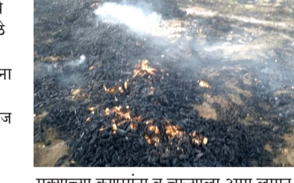
मकाच्या कणसांना व चाऱ्याला आग लागून काही वेळातच मोठे नुकसान झाले. या आगीत दोन्ही शेतकऱ्यांच्या शेतातील अंदाजे २२ ते २५ किंटल मका जळून खाक झाला. घटनेची माहिती मिळताच गावातील

अमळनेर : तालुक्यातील गांधली येथे विजेच्या तारामध्ये झालेल्या शॉर्टसर्किटमुळे लागलेल्या आगीत दोन शेतकऱ्यांच्या शेतातील मका जळून खाक झाला. ही घटना ९ एप्रिल रोजी दुपारी घडली असून सुमारे ५० हजारां रुपयांचे नुकसान झाल्याचा अंदाज व्यक्त करण्यात आला आहे.