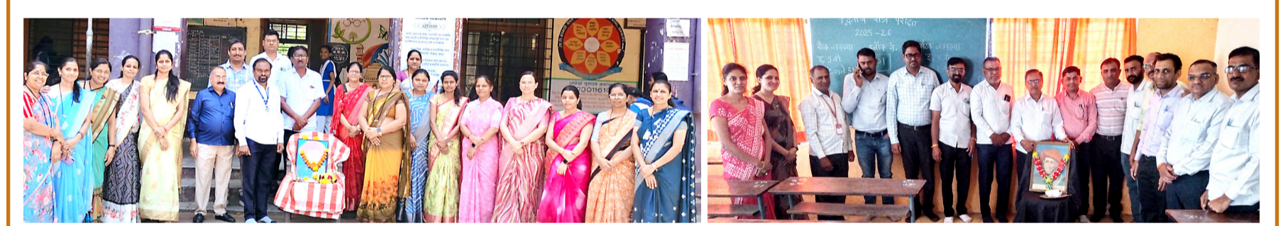
अमळनेर : महात्मा ज्योतिबा फुले यांच्या जयंतीनिमित्त माल्यार्पण करताना सावित्रीबाई फुले माध्यमिक व उच्चमाध्यमिक विद्यालयातील शिक्षक व शिक्षकेत्तर कर्मचारी.