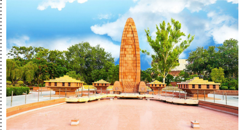
लोकशाही मूल्यांचे रक्षण करण्यासाठी सदैव सजग राहिले पाहिजे. 'स्मरण हेच खरे राष्ट्रभक्तीचे लक्षण आहे.' ज्यांनी आपले प्राण अर्पण केले, त्यांचे

हंटर आयोगाची स्थापना करण्यात आली. तथापि, या चौकशीत जनरल डायरवर कोणतीही कठोर कारवाई करण्यात आली नाही. ज्यामुळे भारतीय जनतेचा रोष आणखी वाढला. जालियनवाला बाग हत्याकांड हे केवळ एक दुःखद घटना नसून, ते भारतीय स्वातंत्र्यलढ्याचा एक निर्णायक टप्पा आहे. या घटनेने भारतीयाना एकत्र आणले आणि स्वातंत्र्य मिळवण्याचा त्यांचा निर्धार अधिक दृढ केला. आज जालियनवाला बाग हत्याकांड दिनानिमित्त आपण त्या निरपराध शहिदांना आदरांजली अर्पण करतो. त्यांचे बलिदान व्यर्थ गेले नाही; त्यांच्या त्यागांमुळेच आपल्याला स्वातंत्र्य मिळाले. या घटनेतून आपण अन्यायाविरुद्ध उभे राहण्याची प्रेरणा घ्यायला हवी आणि