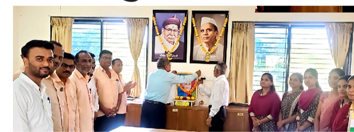
अमळनेर : महात्मा ज्योतिबा फुले यांच्या जयंतीनिमित्त माल्यार्पण करताना स्व. प. छ. भांडारकर कॉलेज ऑफ डीफार्मसी व स्व. रा. केले. कॉलेज ऑफ बी.फार्मसीचे शिक्षक व शिक्षकेत्तर कर्मचारी.

अमळनेर : विद्ये विना मती गेली, मती विना निती गेली...! या उक्तीप्रमाणे अज्ञानाचा अंधकार दूर करणाऱ्या थोर समाजसेवक क्रांतिसूर्य महात्मा ज्योतिबा फुले यांच्या जयंती अमळनेर तालुक्यात उत्साहात साजरी करण्यात आली.