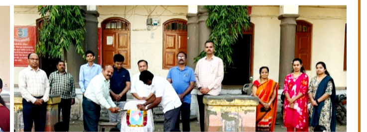
अमळनेर : महात्मा ज्योतिबा फुले यांच्या जयंतीनिमित्त माल्यार्पण करताना प्रताप हायस्कूलचे शिक्षक व शिक्षकेत्तर कर्मचारी व विद्यार्थी.