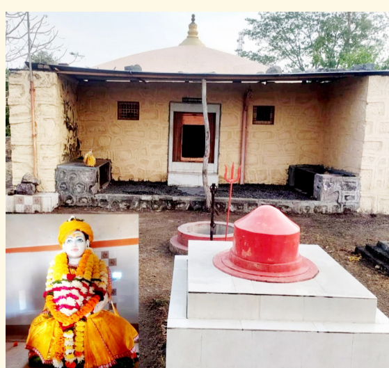
अमळनेर : नाथ संजीवन समाधी मंदिर. इन्स्टेटमध्ये परमपूज्य श्री गोरक्षनाथ मूर्ती.

पाहायला मिळतात. या पवित्र स्थानाचा उल्लेख दिल्लीच्या अल्लाउद्दीन बादशहाने नाथपंथीय तोरणामळ मठाला दिलेल्या सनदेतही आढळतो, ज्यामुळे या स्थळाचे ऐतिहासिक आणि धार्मिक महत्त्व अधोरेखित होते. यंदाही विविध धार्मिक विधी, पूजन आणि आरतीद्वारे जन्मोत्सव साजरा केला जाणार आहे. श्री गोरक्षनाथ जन्मोत्सवानिमित्त मंदिर परिसरात भक्तांची मोठी गर्दी अपेक्षित असून, सर्वांनी शिस्त व भक्तिभाव राखून दर्शनाचा लाभ घ्यावा, असे आवाहन नाथ परिवार आणि नवनाथ भक्त मंडळ, अमळनेर यांनी केले आहे. ▲