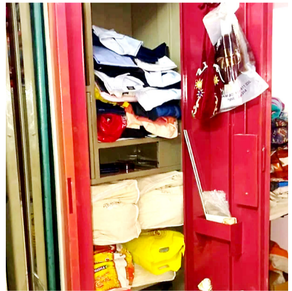
अमळनेर : शहरातील श्रीरंग कॉलनीतील बंद घरातील चोरीवेळी चोरट्यांनी फोडलेले कपाट.

अमळनेर : शहरासह तालुक्यात जवळपास दोन वर्षांपासून चोरी, घरफोडी, विनयभंग, बलात्कार, दोन गटांतील भांडणे आदी थांबल्याचे चित्र शहरवासीयांनी अनुभवले. मात्र, अलीकडेच्या काही दिवसांपासून शहरासह तालुक्यात गुन्हेगारांनी पुन्हा डोके वर काढले असल्याचे दिसून येत आहे. शहरातील पिंपळे रस्त्यावरील समर्थ नगरमधील श्रीरंग कॉलनी येथे रविवार, दि. १२ एप्रिल रोजी बंद घराचा फायदा घेत चोरट्यांनी घरफोडी करून सुमारे सव्वालाख रुपये रोख रक्कम व किरकोळ दागिने लंपास केल्याची उघडकीस आले आहे. त्यामुळे या कॉलनी परिसरासह शहरातील विविध भागांत भीतीचे वातावरण निर्माण झाले आहे.