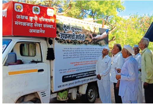
अमळनेर : भूमी सुपोषण चळवळ याबाबत ग्रामस्थ व शेतकरी बांधव उपस्थित राहून माहिती जाणून घेत आहेत.