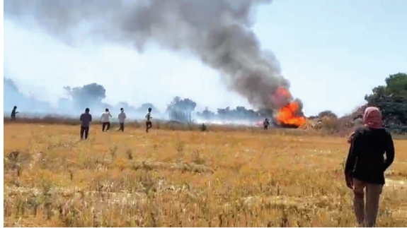
ढेकू तांडा (ता. अमळनेर) : आग विझविण्यासाठी धावपळ करताना ग्रामस्थ

अमळनेर : अमळनेर शहर व तालुक्यात आगीच्या घटनांमध्ये हल्ली सातत्याने वाढ होत आहे. सर्वत्र आगीचे तांडव सुरूच आहे. दि. १५ रोजी दुपारी ढेकू तांडा येथे लागलेल्या भीषण आगीत सुमारे २२ बिघे क्षेत्रातील मका, बाजरी, गहू आणि हरभरा ही पिके जळून खाक झाली. या घटनेमुळे शेतकऱ्यांचे मोठे आर्थिक नुकसान झाले आहे. दुपारी सुमारे २ वाजेच्या सुमारास ढेकू तांडा येथील शेतात अचानक आग लागली. जोरदार वाऱ्यामुळे आगीने अल्पावधितच रौद्ररूप धारण करून २२ बिघे क्षेत्र जळून खाक केले. त्यामुळे शेतातील उष्ण पिकांचे मोठे नुकसान झाले आहे. आगीचे लोण जवळील तांड्यापर्यंत पसरण्याची भीती निर्माण झाली