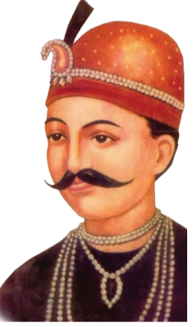
त्यांच्या पराक्रमाची गाथा पुढील पिढ्यांपर्यंत पोहोचवणे हीच त्यांना खरी आदरंजली ठरेल.

स्वातंत्र्यलढ्याला एक मोठा धक्का बसला. परंतु त्यांच्या बलिदानाने पुढील पिढ्यांमध्ये स्वातंत्र्याची ज्वाला अधिक प्रखर केली. आजच्या काळात तात्या टोपे यांचे स्मरण करणे म्हणजे केवळ इतिहास जाणून घेणे नाही, तर त्यांच्या विचारांपासून प्रेरणा घेणे आहे. देशासाठी निःस्वार्थ भावनेने कार्य करणे, संकटांना सामोरे जाण्याची तयारी ठेवणे आणि स्वाभिमानाने जाणे हे त्यांच्या जीवनातून शिकण्यासारखे धडे आहेत. त्यांच्या स्मृतिदिनानिमित्त आपण सर्वांनी त्यांच्या बलिदानाचा सन्मान राखत देशप्रेमाची भावना दृढ करण्याचा संकल्प करावा.