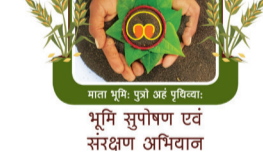
ग्लोबल महादेश वृत्तसेवा

अमळनेर : अक्षय कृषी परिवार आणि मंगळग्रह सेवा संस्था यांच्या संयुक्त विद्यमाने भूमी सुपोषण अभियान राष्ट्रीय चळवळीचा प्रारंभ गुरुवार, दि. १९ मार्च २०२६ रोजी केंद्रीय कृषिमंत्री शिवराजसिंहजी चौहान यांच्या शुभ हस्ते व विविध मंत्री महोदय आणि शेतकऱ्यांच्या उपस्थितीत झाला आहे. त्यानंतर हे अभियान गावपाड्यांसह संपूर्ण देशात राबविण्याचा संकल्प करण्यात आला. त्यानुसार दररोज या अभियानाचा जनजागर अमळनेर तालुक्यातील १५६ गावांमध्ये करण्याचे सुनिश्चित करण्यात आले. त्याप्रमाणे रोज नित्यनियमाने गावागावांत जनजागर रथाच्या माध्यमातून शेतकऱ्यांना अभियानाचा उद्देश, महत्त्व आणि कार्य समजावून सांगितले जात आहे. श्री मंगळग्रह मंदिरात वर्ष प्रतिपदा अर्थात गुढीपाडवा तसेच भूमिमातेचा जन्मदिन या