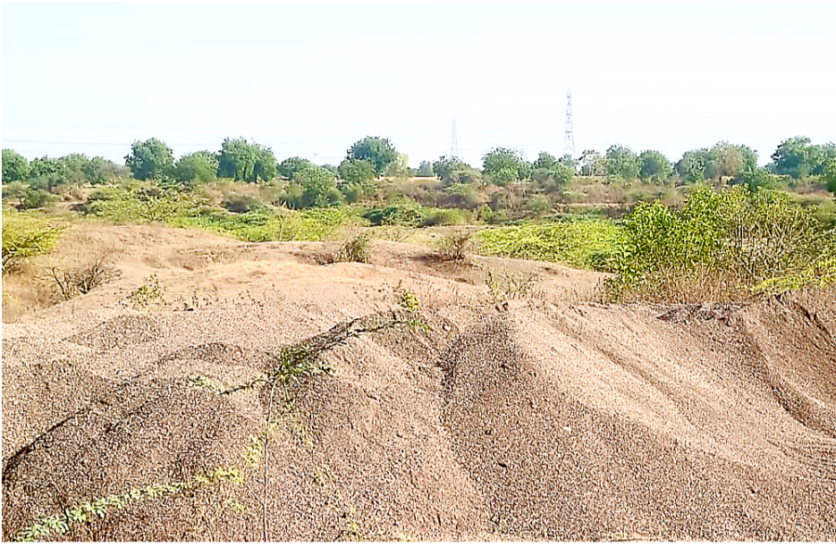
अमळनेर : हिंगोणे व फाफोरे गावांमध्ये ठिकठिकाणी वाळूचे ढिगारे मांडून ठेवण्यात आलेले आहे.