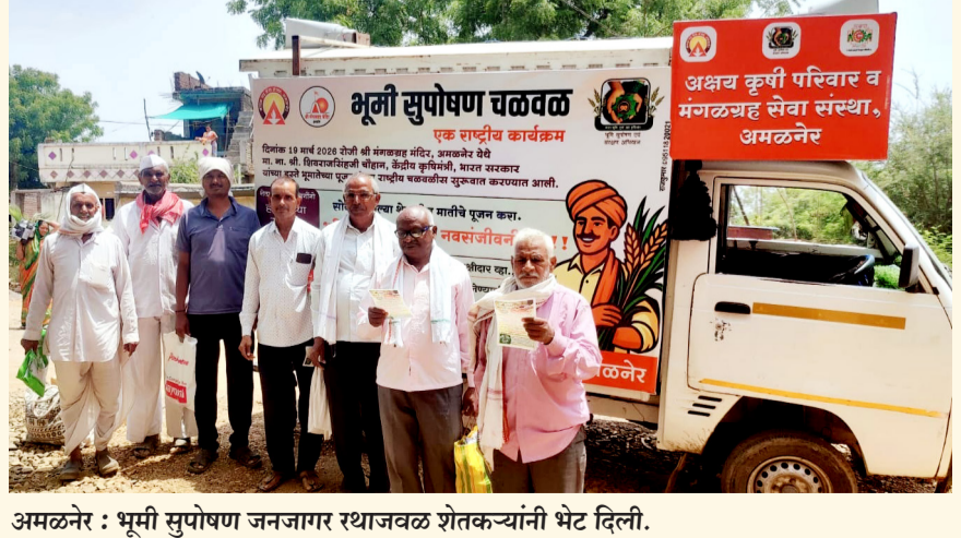
अमळनेर : भूमी सुपोषण जनजागर रथाजवळ शेतकऱ्यांनी भेट दिली.

आणि शेतकरी बांधवांनी रथाचे उत्साहात स्वागत करून या मोहिमेत सहभागी होण्याचा संकल्प केला.या महत्त्वपूर्ण मोहिमेला महाराष्ट्र शासनाच्या कृषी विभागाचे मोलाचे तांत्रिक मार्गदर्शन आणि सहकार्य लाभत आहे. शासकीय यंत्रणा आणि सेवाभावी संस्था यांच्या या एकत्रित प्रयत्नांमुळे 'भूमी सुपोषण अभियान' आता तालुक्याच्या घराघरांत पोहोचले असून, ते एका व्यापक जनआंदोलनाचे स्वरूप धारण करत आहे.