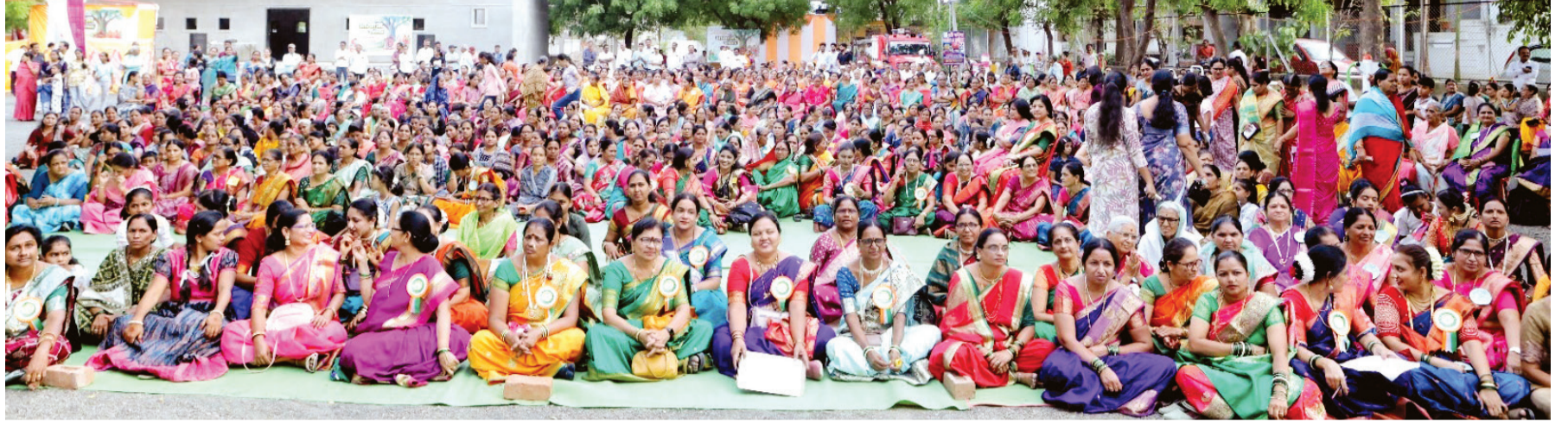
अमळनेर : आखाजी महोत्सवाला महिला भगिनींची मोठ्या संख्येने उपस्थिती.