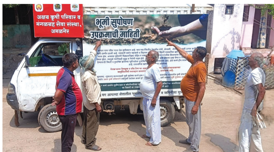
अमळनेर : भूमी सुपोषण राष्ट्रीय अभियान चळवळ रथाचे अवलोकन करताना शेतकरी व ग्रामस्थ.

गुरुवार दि. २३ ला रथाने सकाळी झाडी, एकतास, एकलहरे, भरवस, शहापूर, भिलाळा, तांदळी, खेडी, करणखेडा व खापरखेडे अंबारे या गावांमध्ये रथाचे जोरदार स्वागत करण्यात आले. जमिनीची सुपीकता टिकवून ठेवणे ही केवळ गरज नसून ते आपले कर्तव्य आहे, हा संदेश या पूजाच्या माध्यमातून