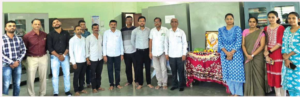
अमळनेर : जागतिक पुस्तक दिन साजरा करताना फार्मसी महाविद्यालयातील शिक्षक, कर्मचारी व विद्यार्थी .