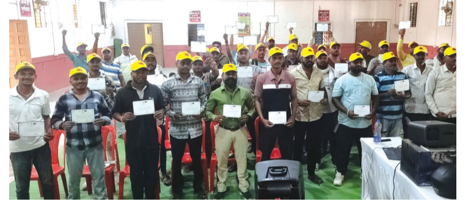
अमळनेर : नगरपरिषद हद्दीतील कचरा वेचकांसाठी विशेष कार्यशाळेत उपस्थित प्रशिक्षणार्थी