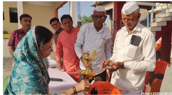
अमळनेर : तासखेडे येथे आयोजित भूमी पूजन व सुपोषण जनजागृती कार्यक्रमाचे दीपप्रज्वलन करताना मान्यवर.

पहिल्यांदाच मोठ्या संख्येने माता-भगिनी उपस्थित होत्या. त्यांच्या हस्ते भूमिपूजन सोहळ्याचे पूजन करण्यात आले. यावेळी अभिमंत्रित केलेली माती शेतकऱ्यांना वाटप करण्यात आली.