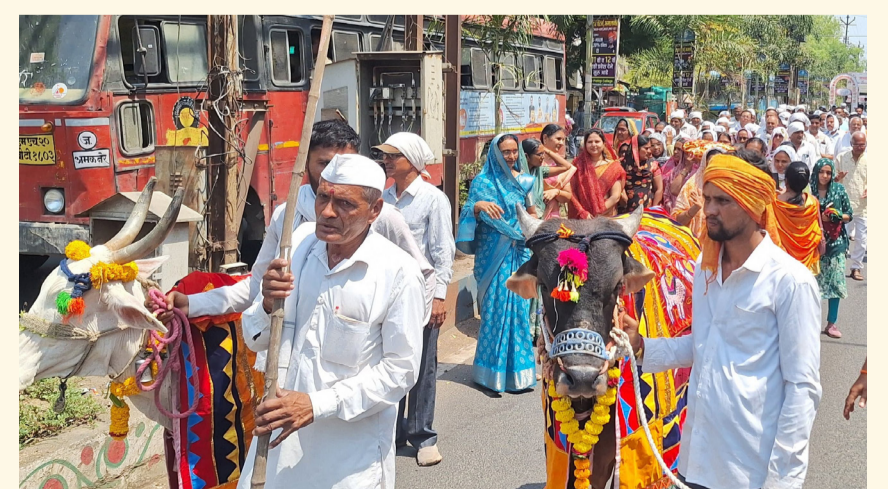
अमळनेर : गौसन्मान रॅलीमध्ये सहभागी झालेले गोसेवक.

तहसीलदारांना हजारो गोसेवकांच्या सहांचे निवेदन देण्यात आले. निवेदनात गो हत्या बंदीचा एक देणू, एकच कडक कायदा करून गौमाता राष्ट्र माता घोषित करावी, केंद्रीय गोसेवा आणि संरक्षण कायदा लागू करावा.सर्व कत्तलखान्यांचे पुरवावे रद्द करावे,स्वतंत्र केंद्रीय गौ मंत्रालय स्थापन करावे यासह अन्य मागण्या करण्यात आल्या. गौमतेवर अपार श्रद्धा ठेवणाऱ्या हिंदू बंधू भगिनींनी यावेळी मोठ्या संख्येने उपस्थिती दिली.