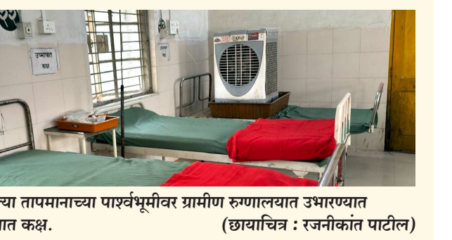
अमळनेर : वाढत्या तापमानाच्या पारवभूमीवर ग्रामीण रुग्णालयात उष्माघात कक्ष सज्ज आलेला उष्माघात कक्ष.

आहे. या पारवभूमीवर, नागरिकांनी दुपारच्या वेळी अनावश्यक घराबाहेर पडणे टाळवे आणि भरपूर पाणी प्यावे, असे आवाहन प्रशासनाकडून करण्यात आले आहे.वाढत्या उष्णतेचा धोका लक्षात घेता, अमळनेर येथील ग्रामीण रुग्णालयात विशेष उष्माघात कक्ष सुरू करण्यात आला आहे.उष्माघाताची लक्षणे जाणवल्यास नागरिकांनी त्वरित वैद्यकीय मदत घ्यावी, अशी सूचना आरोग्य विभागाने केली आहे.