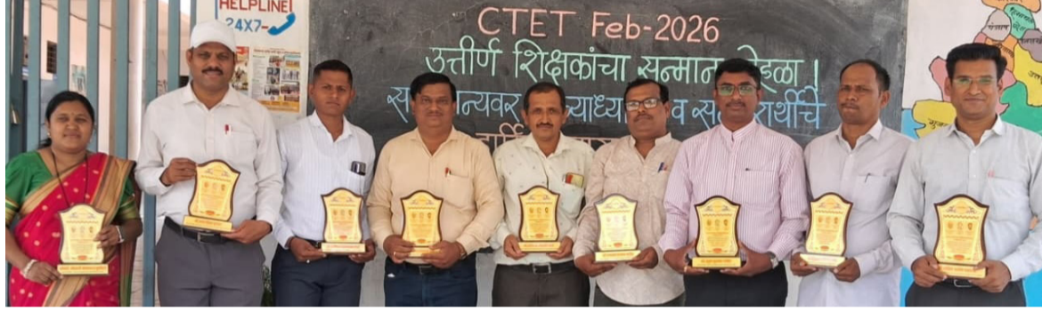
अमळनेर : विजयनामा पाटील आर्मी स्कूल अॅण्ड ज्युनिअर कॉलेजमध्ये नवलभाऊ प्रतिष्ठान, रुख्मिणीताई प्रतिष्ठान (मुंबई), संजय एज्युकेशन सोसायटी व ग्रामविकास मंडळ यांच्या संयुक्त विद्यमाने आयोजित केंद्रीय शिक्षक पात्रता परीक्षा (फेब्रुवारी २०२६) उत्तीर्ण शिक्षकांच्या सन्मान सोहळ्यास उपस्थित सीटीईटी उत्तीर्ण सन्मानित शिक्षक, शिक्षिका.