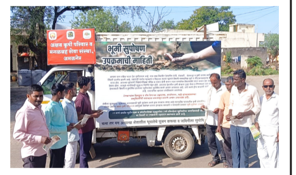
सुपीकता टिकवून ठेवणे ही केवळ गरज नसून ते आपले कर्तव्य आहे, हा संदेश या पूजनाच्या माध्यमातून दिला जात आहे. रासायनिक शेतीचे मानवी आरोग्यावर आणि जमिनीवर होणारे दुष्परिणाम, तसेच जैविक (सेंट्रिय) शेतीचे दीर्घकालीन फायदे सांगणारी माहितीपत्रके प्रत्येक कुटुंबापर्यंत पोहोचवली जात आहेत. या मोहिमेला महाराष्ट्र शासनाच्या कृषी विभागाचे तांत्रिक आणि मोलाचे सहकार्य लाभत आहे. अक्षय कृषी परिवार आणि मंगळग्रह सेवा संस्था, अमळनेर यांच्या संयुक्त विद्यमाने हे अभियान राबवले जात आहे. ▲

अमळनेर : वाढता रासायनिक खतांचा वापर आणि त्यामुळे खालावलेली जमिनीची सुपीकता यावर मात करण्यासाठी अमळनेर तालुक्यात भूमी सुपोषण राष्ट्रीय अभियानाने चळवळ उभी केली आहे. आपल्या अन्नदात्या भूमीला पुन्हा एकदा सुजलाम-सुफलाम करण्यासाठी आणि शेतीला तिचे हरवलेले गतवैभव राबविले जात आहे. ११ एप्रिलपासून जनजागृतीची मशाल आता तालुक्याच्या कानाकोपऱ्यात प्रकाश पसरवत आहे. या अभियानांतर्गत एक विशेष जनजागर रथ तयार करण्यात आला आहे. शुक्रवार दि. १ मे ला सकाळी रथाने व्यवहारदळ, खेडी, रामेश्वर खुर्द, रामेश्वर बुद्रुक, कामतवाडी, डेकू सिम, डेकू खुर्द, डेकू चारम, अंबासन व जुनवणे या गावांना भेटी देऊन शेतकऱ्यांशी संवाद साधला. शनिवार दि. २ मे ला सकाळी बामणे