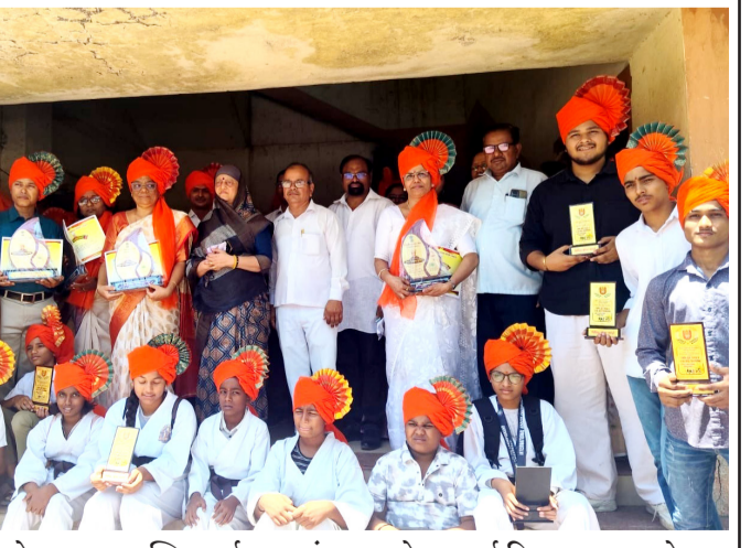
अमळनेर : खासदार स्मिताताई वाघ यांच्या समवेत आदर्श शिक्षक पुरस्काराने सन्मानित शिक्षक व विद्यार्थी.