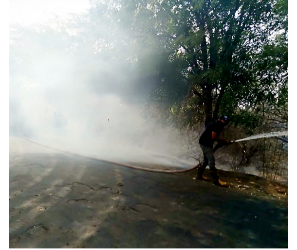
अमळनेर : आग लागलेल्या शेतातील चारा विझविताना अग्निशामक कर्मचारी