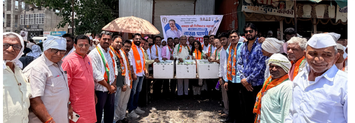
अमळनेर : राज्याचे जलसंपदामंत्री मा. ना. गिरीशभाऊ महाजन यांच्या वाढदिवसानिमित्त अमळनेरसह तालुक्यात विविध सामाजिक उपक्रमांचे आयोजन करण्यात आले. त्यात भारतीय जनता पार्टी युवा मोर्चा अमळनेरतर्फे बसस्थानक परिसरात प्रवाशांना नारळ पाणी वाटपप्रसंगी उपस्थित मान्यवर.

मंगळग्रह सेवा संस्था व तीर्थक्षेत्र विकास आघाडी भाजप जिल्हा यांच्या वतीने अमळनेर-चोपडा नाका येथे पाणपोईचे उद्घाटन करण्यात आले. उन्हाच्या तीव्रतेच्या शारद्वर्भूमीवर नागरिकांना शुद्ध व थंड पाणी उपलब्ध व्हावे या उद्देशाने हा उपक्रम सुरू करण्यात आला. तसेच मंगळग्रह मंदिर परिसरात मोतीबिंदू तपासणी शिबिर व रक्तदान शिबिराचे आयोजन