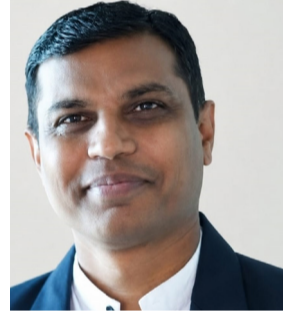
ग्लोबल महातेज वृत्तसेवा