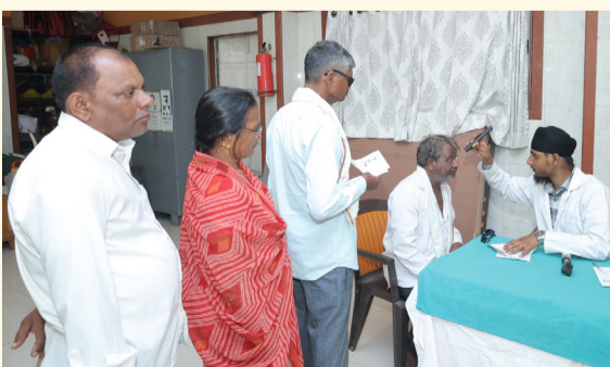
अमळनेर : मंगळग्रह सेवा संस्थेतर्फे आयोजित मोफत मोतीबिंदू तपासणी शिबिरातर्गत रविवारी तपासणी करताना वैद्यकीय अधिकारी. दुसऱ्या छायाचित्रात शिबिरासाठी

अमळनेर : येथील मंगळग्रह सेवा संस्था, मा. ना. गुलाबरावजी पाटील सोशल फाऊंडेशन (पाळधी), संकल्प सेवा फाऊंडेशन (धनवाडी) व आर. झुणझुणवाला शंकरा आय हॉस्पिटल (पनवेल) यांच्यातर्फे रविवार, दि. १७ एप्रिल रोजी श्री मंगळग्रह मंदिरात मोफत मोतीबिंदू तपासणी शिबिर झाले. या शिबिराचा ७४ रुग्णांनी लाभ घेतला. पैकी ३९ रुग्ण मोतीबिंदू शस्त्रक्रियेसाठी पात्र उरले. रविवारी, दि. १७ एप्रिल रोजी श्री मंगळग्रह मंदिर येथून विशेष वाहनाने आर. झुणझुणवाला शंकरा आय हॉस्पिटल