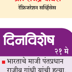
श्री. राजेंद्र चौधरी रेंट्रिन्गेशन सल्लिसेस