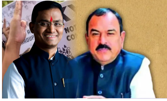
ग्लोबल महातेज वृत्तसेवा

अमळनेर : 'एक हजार कोटींचा मालक' म्हणून ओळखला जाणारा व्यक्ती जेव्हा चौकशी यंत्रणेकडून अर्थात 'सीबीआय'कडून तोंडाला रुमाल बांधून नेला जातो तेव्हा समाजाला एक कठोर वास्तव समोर दिसते. अनैतिकतेच्या पायावर उभे राहिलेले साम्राज्य कितीही मोठे असले, तरी त्याचा अंत निश्चित असतो. गेल्या काही वर्षांत आर्थिक गैरव्यवहार, भ्रष्टाचार, फसवणूक, काळा पैसा, सत्तेचा गैरवापर आणि राजकीय संरक्षण यांच्या जोरावर उभे राहिलेले अनेक तथाकथित 'बलाढ्य' लोक काही क्षणांतच कोसळताना