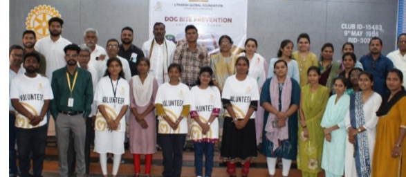
अमळनेर : रोटीर हॉल येथे आयोजित श्वान चावा प्रतिबंध जनजागृती पथनाट्य सादर केलेल्या चमू सोबत रोटीरियन्स.