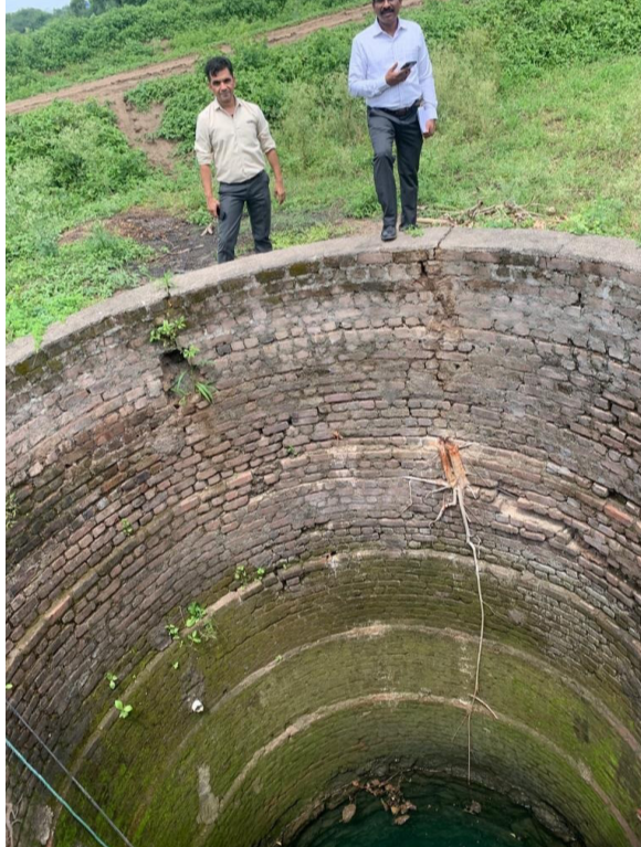
अमळनेर : अधिग्रहीत केलेली विहीर.

तालुक्यातील सुमारे १७ गावांच्या पाणीपुरवठा योजना पूर्ण झालेल्या असल्या तरी वीज जोडणीअभावी त्या सुरु होऊ शकलेल्या नाहीत.