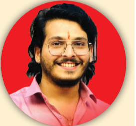
श्री. आशिष वर्मा ज्वेलर्स