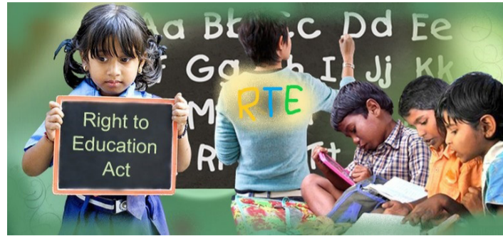
३६ तर दुसऱ्या फेरीत ११ अर्ज प्राप्त झाले होते. त्यापैकी अनुक्रमे २५ व ६ विद्यार्थ्यांना प्रवेश मंजूर करण्यात आला. याशिवाय स्वामी विवेकानंद आंतरराष्ट्रीय शाळा, सायरदेवी बोहरा सेंट्रल शाळा, न्यू व्हिजन इंग्रजी

की, पहिल्या फेरीत तालुक्यातील १४ शाळांसाठी १४५ अर्ज प्राप्त झाले होते. त्यापैकी ९६ विद्यार्थ्यांना प्रवेश मंजूर करण्यात आला. १५ अर्ज प्रलंबित राहिले असून काही अर्जांवरील निर्णय प्रक्रिया अद्याप सुरू आहे. दरम्यान, दुसऱ्या फेरीत पहिली व दुसरी फेरी मिळून एकूण १४५ अर्ज प्राप्त झाले असून त्यापैकी १२३ विद्यार्थ्यांचे प्रवेश निश्चित झाले आहेत. तर २२ अर्ज अद्याप प्रलंबित असल्याची माहिती शिक्षण विभागाकडून देण्यात आली. याबाबत अधिक माहिती अशी